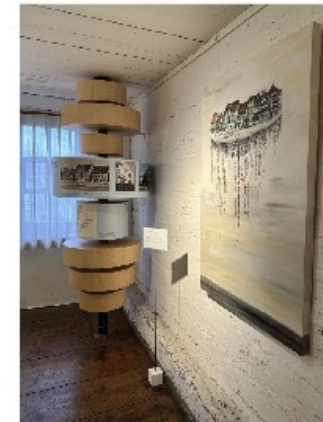
«Reise in die Vergangenheit», Karin E. Pinato