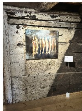
«Fish in Smoker», Jeannette Egger