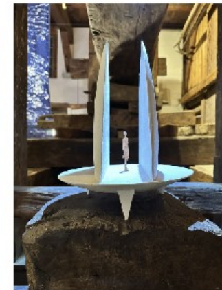
«Druck», Pascal Pulli